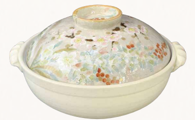
NZS090 瑞光 冬草花 九号鍋(白) 1 紙箱 ¥15,000 税込¥16,200 φ28×H16cm 容量3500ml NZS090-02 IH・プレート式 ¥18,000 NZS090-01 IH・カーボン式 ¥30,000