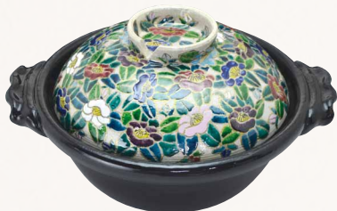
NZS111 瑞光 色彩椿 八号京鍋(黒) 1 紙箱 ¥20,000 税込¥21,600 φ26×H15cm 容量1800ml NZS111-01 IH・プレート式 ¥22,500