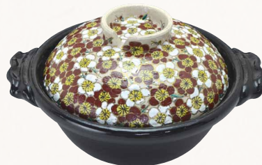
NZU110 瑞光 梅尽し 八号京鍋(黒) 1 紙箱 ¥20,000 税込¥21,600 φ26×H15cm 容量1800ml NZU110-01 IH・プレート式 ¥22,500