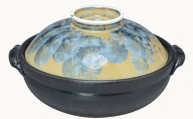
トウ7681 陶葎 花結晶(灰青) 八号鍋(黒) 1 紙箱 ¥13,000 税込¥14,040 φ25.5×H15.5cm 容量2300ml トウ7681-02 IH・プレート式 ¥15,500 トウ7681-01 IH・カーボン式 ¥26,000