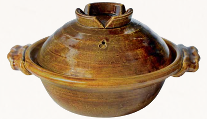
トウア685 陶葎 飴釉 八号京鍋 1 紙箱 ¥18,000 税込¥19,440 φ26×H15cm 容量1800ml トウア685-01 IH・プレート式 ¥20,500