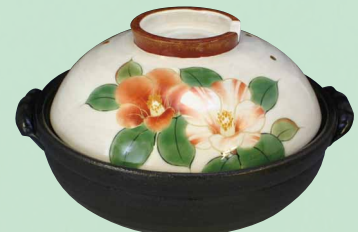
トウア668 陶葎 白掛梅椿 八号鍋(黒) 1 紙箱 ¥40,000 税込¥43,200 φ25.5×H15.5cm 容量2300ml