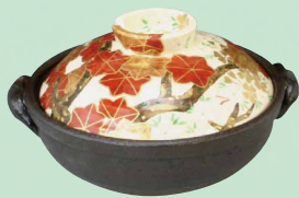
NZU018 善昇 雲綿図 六号鍋(黒) 1 紙箱 ¥30,000 税込¥32,400 φ19.5×H11.5cm 容量1000ml

特別価格にて納入させていただきます。詳しくはお問合せ下さい。 在庫がなくなり次第、終了とさせていただきます。