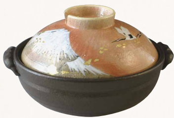
NZK102 瑞光 金彩富士 八号鍋(黒) 1 紙箱 ¥16,000 税込¥17,280 φ25.5×H15cm 容量2300ml NZK102-02 IH・プレート式 ¥18,500 NZK102-01 IH・カーボン式 ¥29,000