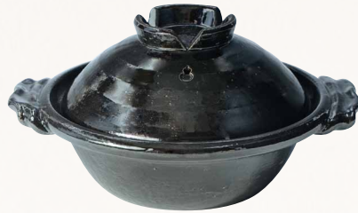
トウア686 陶葎 黒釉 八号京鍋 1 紙箱 ¥18,000 税込¥19,440 φ26×H15cm 容量1800ml トウア686-01 IH・プレート式 ¥20,500