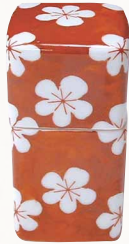
SAH120 紫泉 赤小梅 角 楊枝入 1 紙箱 ¥4,000 税込¥4,320 W4×H4×H8cm ※汁注、薬味入もごさいます。