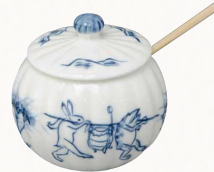
NEW トウア774 紫泉 鳥獣戯画 薬味入(竹匙付) 1 紙箱 ¥2,500 税込¥2,700 φ5.5×H5cm ※汁注、楊枝入もごさいます。