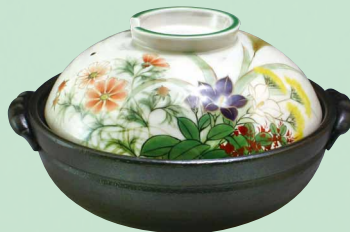
トウア669 陶葎 白掛草花 八号鍋(黒) 1 紙箱 ¥30,000 税込¥32,400 φ25.5×H15.5cm 容量2300ml