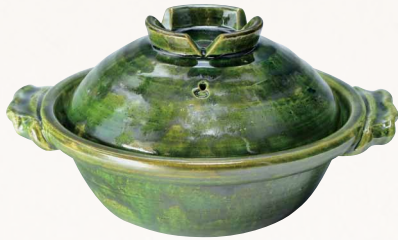
トウア684 陶葎 緑釉 八号京鍋 1 紙箱 ¥18,000 税込¥19,440 φ26×H15cm 容量1800ml トウア684-01 IH・プレート式 ¥20,500