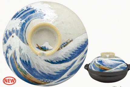
NEW NZN113 瑞光 富士・波裏 八号鍋(黒) 1 紙箱 ¥16,000 税込¥17,280 φ25.5×H15cm 容量2300ml NZC100-02 IH・プレート式 ¥18,500 NZC100-01 IH・カーボン式 ¥29,000