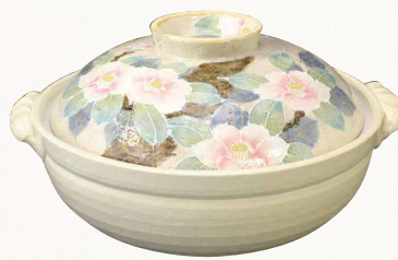
NZB089 瑞光 椿絵 九号鍋(白) 1 紙箱 ¥15,000 税込¥16,200 φ28×H16cm 容量3500ml NZB089-02 IH・プレート式 ¥18,000 NZB089-01 IH・カーボン式 ¥30,000