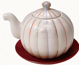
SBH066 紫泉 糸車 汁注(朱台付) 1 紙箱 ¥4,500 税込¥4,860 φ7×H7cm 容量150ml ※薬味入、楊枝入もごさいます。