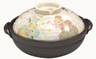
NZC100 瑞光 七福神 八号鍋(黒) 1 紙箱 ¥13,000 税込¥14,040 φ25.5×H15cm 容量2300ml NZC100-02 IH・プレート式 ¥15,500 NZC100-01 IH・カーボン式 ¥26,000