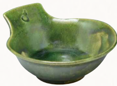
トウア687-01 陶葎 緑釉 取鉢 1 紙箱 ¥3,000 税込¥3,240 W15×D13.5×H6cm