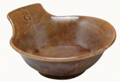
トウア688-01 陶葎 飴釉 取鉢 1 紙箱 ¥3,000 税込¥3,240 W15×D13.5×H6cm