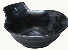
トウア689-01 陶葎 黒釉 取鉢 1 紙箱 ¥3,000 税込¥3,240 W15×D13.5×H6cm