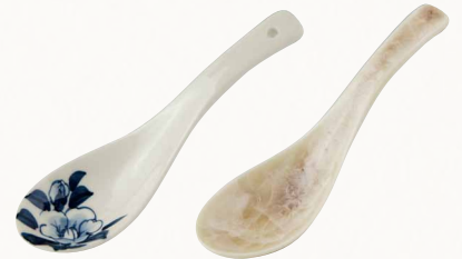
(左)KMG-075-07 染花椿(青) れんげ 1 (右)KMG-075-03 花結晶(茶) れんげ 1 裸 各¥1,500 税込¥1,620 W13.5×D4×H2.5cm 陶葎