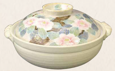
NZB089 瑞光 椿絵 九号鍋(白) 1 紙箱 ¥15,000 税込¥16,500 φ28×H16cm 容量3500ml NZB089-02 IH・プレート式 ¥17,000 NZB089-01 IH・カーボン式 ¥30,000