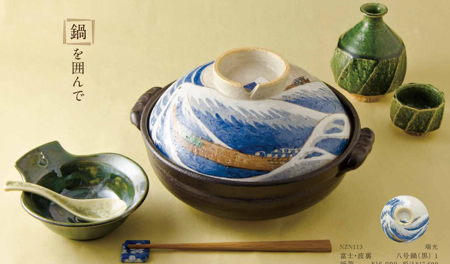
NZN113 瑞光 富士・波裏 八号鍋(黒) 1 紙箱 ¥16,000 税込¥17,600 φ25.5×H15cm 容量2300ml NZC100-01 IH・カーボン式 ¥29,000