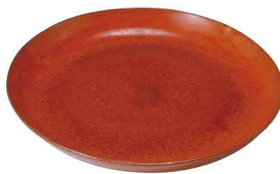
PMC024 嘉峰柿釉 尺皿 1 紙箱 ¥10,000 税込¥11,000 φ30×H5cm