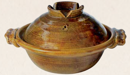
トウア685 陶葎 飴釉 八号京鍋 1 紙箱 ¥18,000 税込¥19,800 φ26×H15cm 容量1800ml