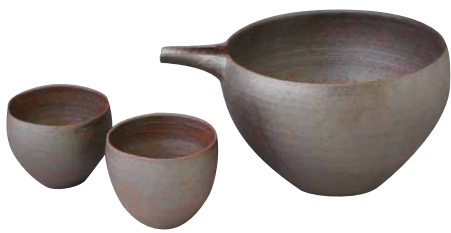
RHN175 片口容量340ml 花月南蛮 お預け酒器 1:2 紙箱 ¥8,000 税込¥8,800 片口1 W14×D10.5×H6.5cm ¥4,800 ぐい呑1 φ5×H4cm ¥1,600