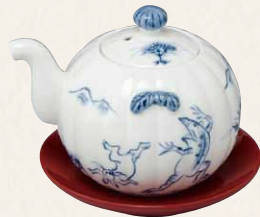
トウア773 陶葎 鳥獸戯画 汁注(朱台付) 1 紙箱 ¥5,500 税込¥6,050 φ7×H7cm 容量150ml ※薬味入、楊枝入もごさいます。