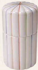
SBH068 紫泉 糸車 楊枝入 1 紙箱 ¥2,500 税込¥2,750 φ5×H8cm ※汁注、薬味入もごさいます。