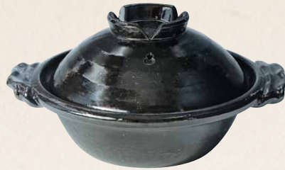
トウア686 陶葎 黒釉 八号京鍋 1 紙箱 ¥18,000 税込¥19,800 φ26×H15cm 容量1800ml