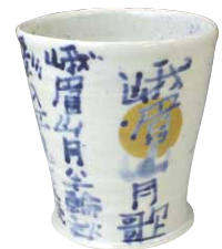
GHG313 伯耆峨眉山 焼酎杯 1 紙箱 ¥5,000 税込¥5,500 φ9×H9.5cm 容量310ml