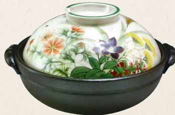
トウア669 陶葎 白掛草花 八号鍋(黒) 1 紙箱 ¥30,000 税込¥33,000 φ25.5×H15.5cm 容量2300ml