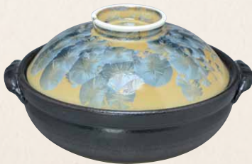
トウア681 陶葎 花結晶(灰青) 八号鍋(黒) 1 紙箱 ¥13,000 税込¥14,300 φ25.5×H15.5cm 容量2300ml

特別価格にて納入させていただきます。詳しくはお問合せ下さい。 在庫がなくなり次第、終了とさせていただきます。