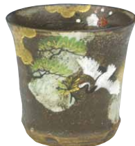
GBK319 八幡吉祥鶴 タンブラー 1 紙箱 ¥5,000 税込¥5,500 φ8.5×H8.5cm 容量250ml