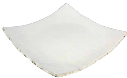
PBK673 匠粉引 七、五寸角皿 1 紙箱 ¥5,000 税込¥5,500 W23×D23×H4cm