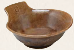
トウア688-01 陶葎 飴釉 取鉢 1 紙箱 ¥3,000 税込¥3,300 W15×D13.5×H6cm