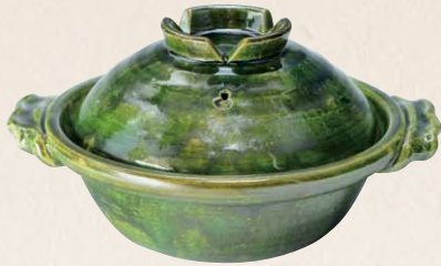
トウア684 陶葎 緑釉 八号京鍋 1 紙箱 ¥18,000 税込¥19,800 φ26×H15cm 容量1800ml