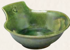
トウア687-01 陶葎 緑釉 取鉢 1 紙箱 ¥3,000 税込¥3,300 W15×D13.5×H6cm