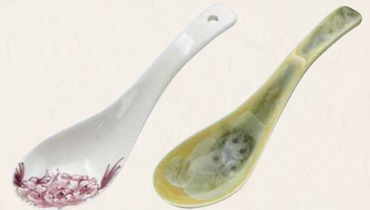
(左)FW-608-02 染花牡丹(紫) れんげ 1 (右)FW-611 花結晶(黄) れんげ 1 裸 各¥1,500 税込¥1,650 W13.5×D4×H2.5cm 陶葎