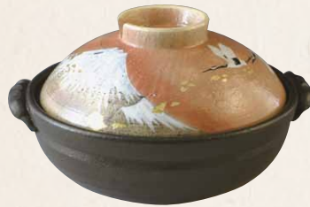
NZK102 瑞光 金彩富士 八号鍋(黒) 1 紙箱 ¥16,000 税込¥17,600 φ25.5×H15cm 容量2300ml NZK102-01 IH・カーボン式 ¥29,000