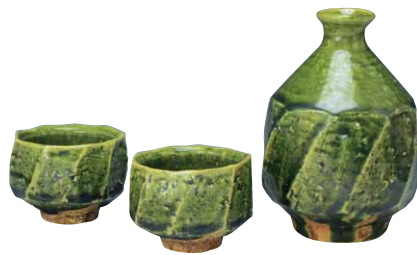
ROM094 徳利容量320ml 木野織部面取 お預け酒器 1:2 紙箱 ¥12,000 税込¥13,200 徳利1 φ8.5×H13cm ¥6,000 ぐい呑1 φ6.5×H5cm ¥3,500