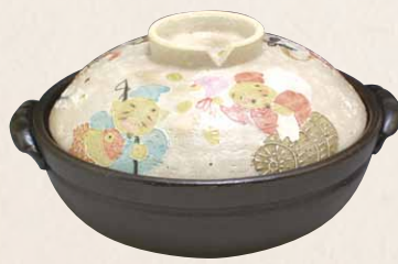
NZC100 瑞光 七福神 八号鍋(黒) 1 紙箱 ¥13,000 税込¥14,300 φ25.5×H15cm 容量2300ml NZC100-01 IH・カーボン式 ¥26,000