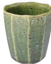
COM624 木野織部面取 フリーカップ 1 紙箱 ¥3,500 税込¥3,850 φ8×H9.5cm 容量280ml