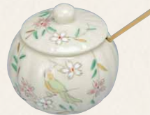
SBI005 紫泉 花丸花鳥 薬味入(竹匙付) 1 紙箱 ¥3,300 税込¥3,630 φ5.5×H5cm ※汁注、楊枝入もごさいます。