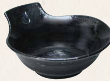
トウア689-01 陶葎 黒釉 取鉢 1 紙箱 ¥3,000 税込¥3,300 W15×D13.5×H6cm