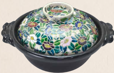
NZS111 瑞光 色彩椿 八号京鍋(黒) 1 紙箱 ¥20,000 税込¥22,000 φ26×H15cm 容量1800ml