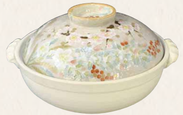
NZS090 瑞光 冬草花 九号鍋(白) 1 紙箱 ¥15,000 税込¥16,500 φ28×H16cm 容量3500ml NZS090-02 IH・プレート式 ¥17,000 NZS090-01 IH・カーボン式 ¥30,000