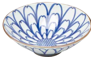
BVM088-01 岩華菊割 五寸平鉢 1 紙箱 ¥5,000 税込¥5,500 φ16×H5.5cm