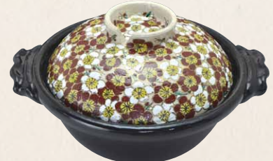
NZU110 瑞光 梅尽し 八号京鍋(黒) 1 紙箱 ¥20,000 税込¥22,000 φ26×H15cm 容量1800ml