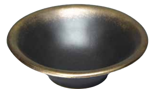
BVU540 匠黒釉金彩 小鉢 1 紙箱 ¥3,000 税込¥3,300 φ14.5×H5cm