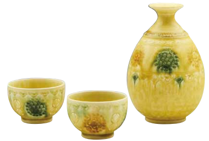
RJY202 徳利容量260ml 治兵衛袖彩花三島 お預け酒器 1:2 紙箱 ¥9,000 税込¥9,900 徳利1 φ8×H12cm ¥4,000 ぐい呑1 φ6×H4cm ¥2,500